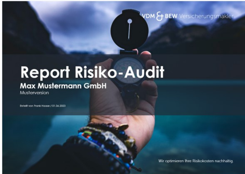
Risiko-Sicht: 360°-Sicht gem. Risiko-Audit